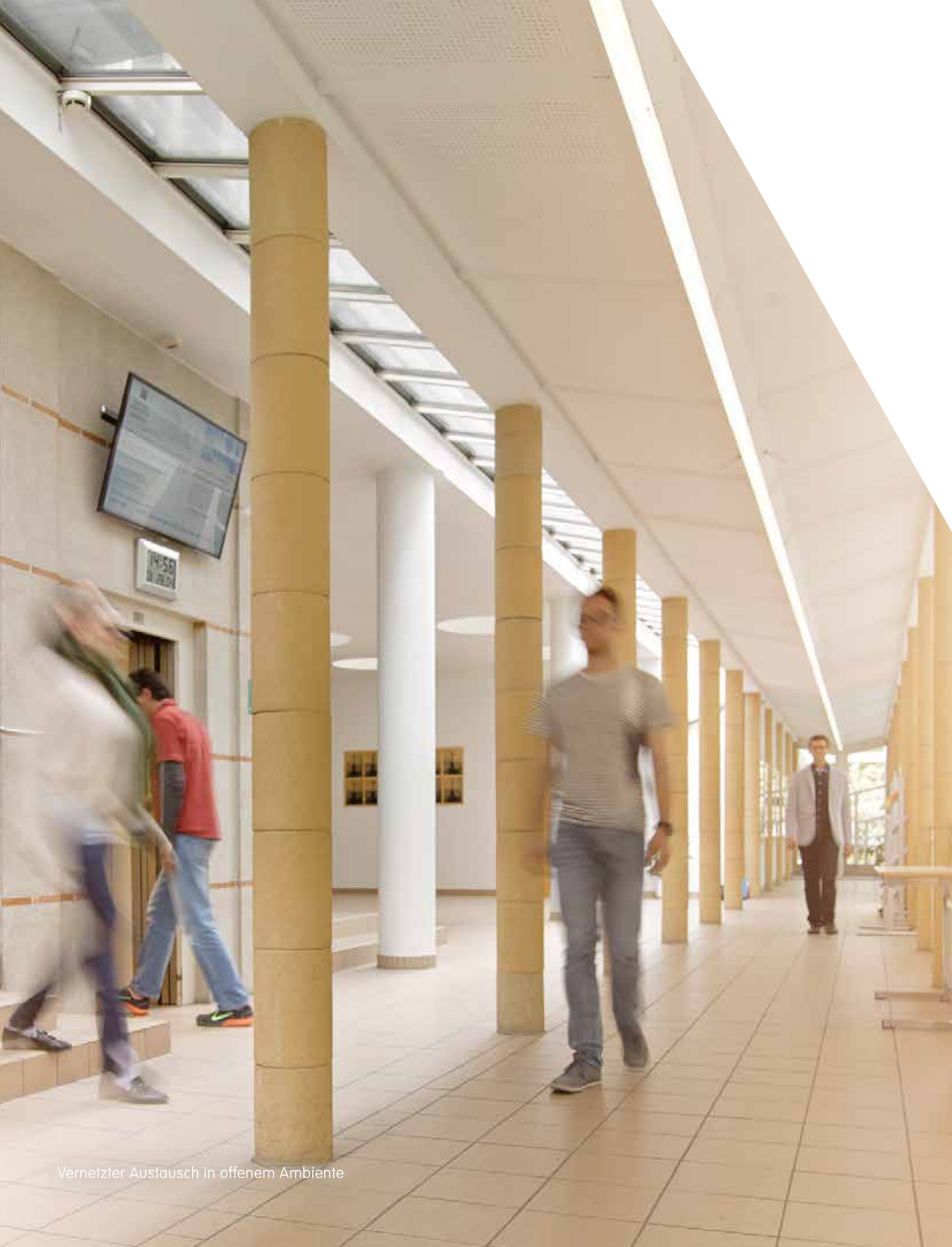
Vernetzter Austausch in offenem Ambiente