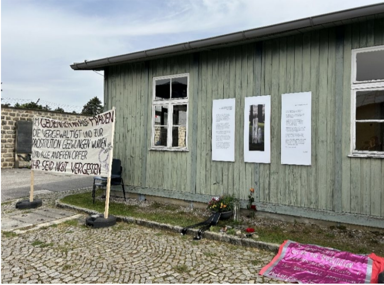
Feministisches Frauengedenken vor der ehemaligen Bordellbaracke in der KZ-Gedenkstätte Mauthausen, Mai 2024.

Den als „asozial“ und „kriminell“ Verfolgten blieb die Anerkennung als Opfer des Nationalsozialismus in der Bundesrepublik Deutschland bis 2020 und in Österreich sogar bis 2024 verwehrt. Für die Opfer kam diese Anerkennung und der daraus resultierende Anspruch auf Entschädigung allerdings zu spät 32 – viele waren bereits verstorben. Was bleibt, ist der symbolische Wert.