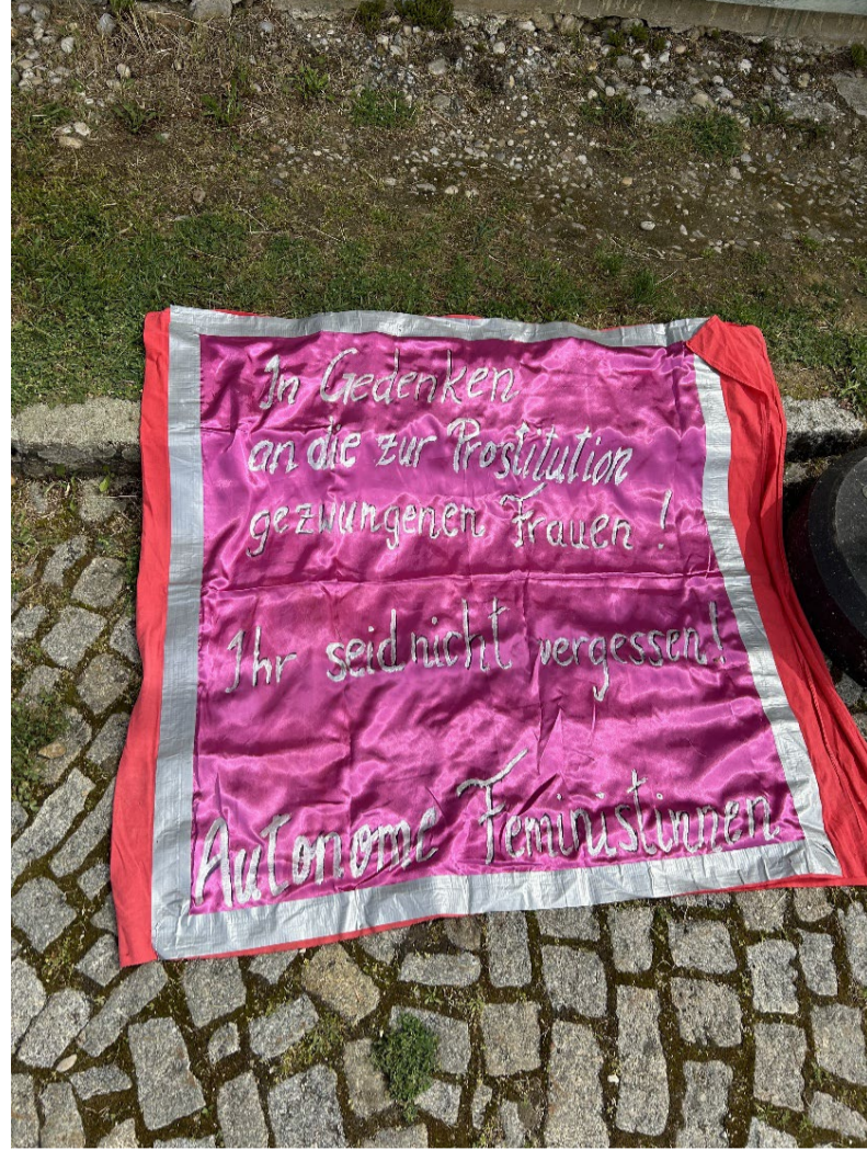
Feministisches Frauengedenken vor der ehemaligen Bordellbaracke in der KZ-Gedenkstätte Mauthausen, Mai 2024.

(wissenschaftliche Mitarbeiterinnen der Forschungsstelle der KZ-Gedenkstätte Mauthausen | Mauthausen Memorial)