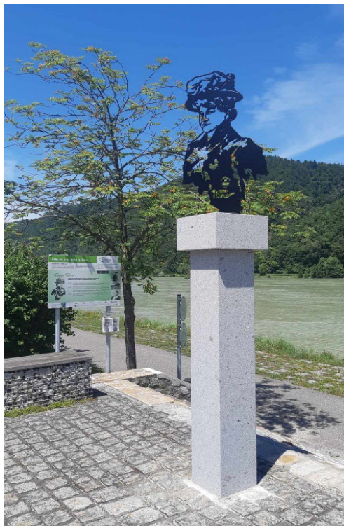
Skulptur und Texttafel Rosa Beer an der Donauuferpromenade (Wesenufer, 2024)

Am Ende der Recherchen für mein Buch habe ich den Grabstein von Louis Beer, der sich im alten jüdischen Teil des Wiener Zentralfriedhofes befindet, erneuern und die Schrift nachzeichnen lassen, mit dem Zusatz: „In memoriam Sohn Ludwig Beer, geboren 27. März 1919, hingerichtet 20. September 1944 im KZ Dachau“. 12