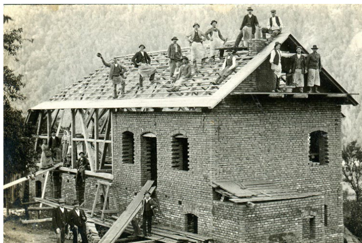
Hausbau auf der Kager Nr. 5 (Wesenufer, 1919), Foto: Anton Gahleitner

Eben hier im Heimatort von Rosa wollen sie den Traum von einer eigenen Sommerfrische und einem Alterssitz wahr werden lassen. Neben dem Haus, das für das Gesinde gedacht ist, das sich um die Bewirtschaftung des Anwesens ganzjährig kümmern soll, ist schon die