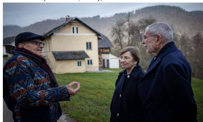
Bundespräsident Van der Bellen vor dem Haus auf der Kager Nr.5