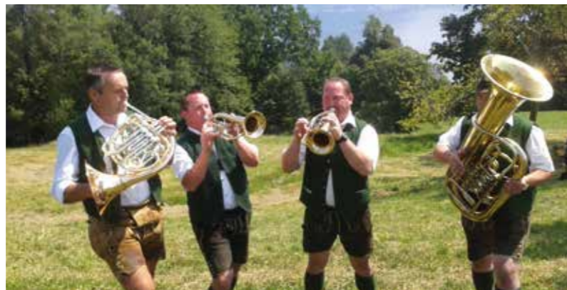
Pinsdorfer Weisenbläser beim Bläserfest am Gmundnerberg 2015

VERTRÄUMTE BLÄSERKLÄNGE AN EINEM LAUEN SOMMERABEND, klar intonierte Weisen bei einem Wertungsblasen oder ein frischer Jodler eines Flügelhornduos auf einer Alm – in den Sommermonaten haben Arien- und Weisenbläser Hochsaison und damit auch diverse Bläserfeste, Arien- und Weisenbläsertreffen. Auch heuer wieder gibt es viele Möglichkeiten, in diesen musikalischen Genuss zu kommen.