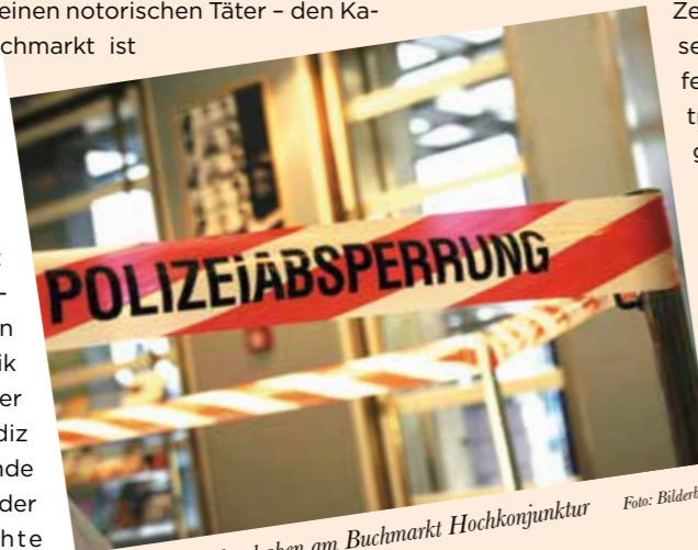
Mord & Totschlag haben am Buchmarkt Hochkonjunktur

Franz Zeller: Sterben ist das Letzte. Ein Salzburg-Krimi. Knauer.