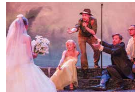
Uraufführung von „Werther lieben“, des vielfach ausgezeichneten Autors Thomas Arzt im Theater Phönix

M it der Uraufführung des Auftragswerkes Das Wasser im Meer des bayerischen Dramatikers Christoph Nussbaumedler zeigen die Kammerstücke einen zeitgemäßen