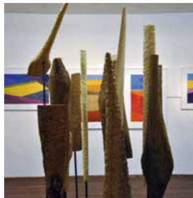
Blick in die Ausstellung „Die Neuen“ in der Cart-Galerie in Pregarten