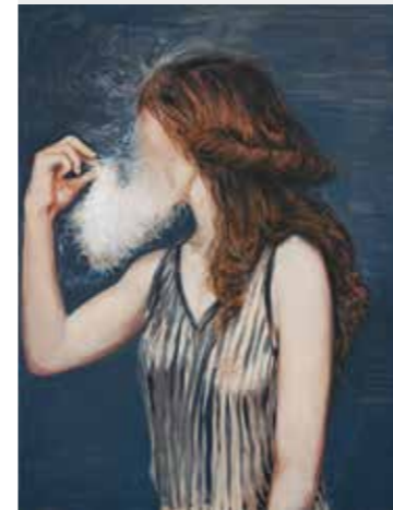
Bildbeschriftung und Bildrecht: Bonjour Tristesse