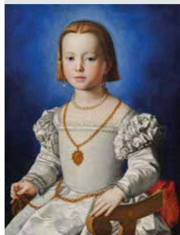
Agnolo Bronzino, Maria de' Medici (1540–1557), 1550 (?)