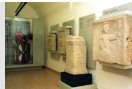
Bildbeschriftung und Bildrecht: Römersteine