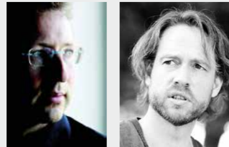
Bildbeschriftung und Bildrecht: Reinhard Mayr und Bernhard Pötsch