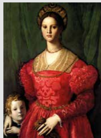
Agnolo Bronzino, Maria de' Medici mit ihrem Bruder Don Antonio, um 1556/57