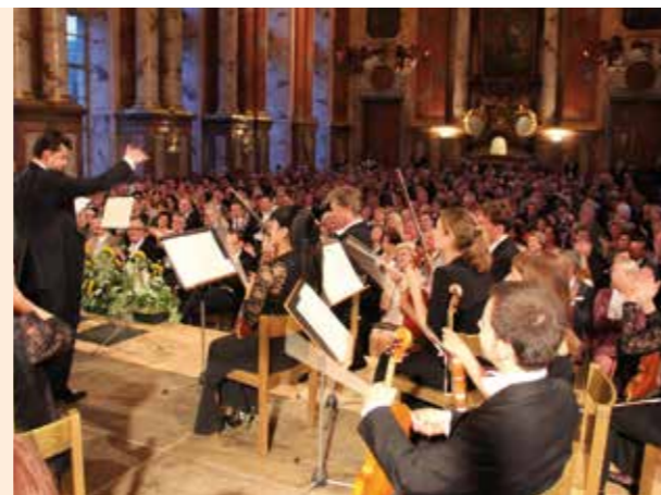
Julian Rachlin und das Bruckner Orchester beim Start der Stiftskonzerte 2016

und Mozarts Sinfonie Nr. 40 in g-Moll begeistert zwar das Publikum, kämpft aber vor allem im 3. und 4. Satz der Sinfonie durch überzogene Tempi mit der heiklen Saal-Akustik. Zu gleicher Zeit gastiert der zum Weltstar avancierte Tenor Piotr Beczala im Linzer Musiktheater und erringt mit seinem Werke von Schumann, Karłowicz und Dvorak umspannenden Liederabend vor vollem Haus einen triumphalen Erfolg. Der Nachmittag des gleichen Tages gehörte im Brucknerhaus jenen, die dereinst Vorbildern wie Rachlin oder Beczala nacheifern könnten: Hochtalentierte Preisträger/innen des Bundeswettbewerbs „prima la musica“ gaben auf hohem Niveau staunenswerte Proben ihres jetzt schon großen Könnens zum Besten.