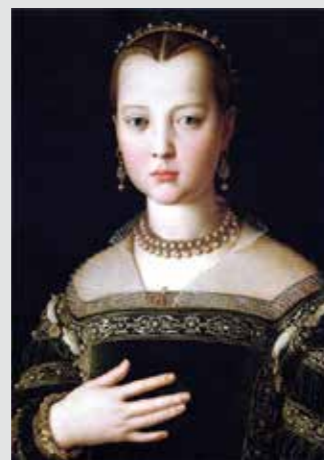
Agnolo Bronzino, Maria de' Medici 1553