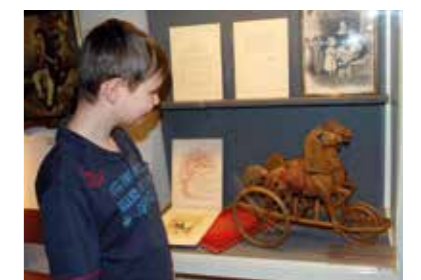
Eine Vitrine zeigt Holzspielzeug des kleinen Franz Josef

Nähere Informationen unter: www.stadtmuseum.at