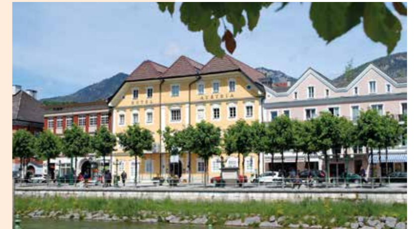
Hotel Austria: Dort wo heute das Stadtmuseum ist, hat Franz Josef einst Verlobung gefeiert