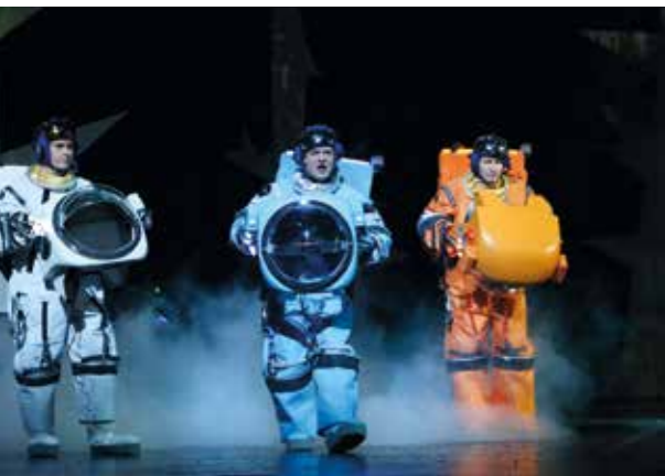
Szenenausschnitt aus „Terra Nova“ in Linzer Musiktheater

Der heftig akklamierte Leistungsbe- weis sollte jeden Einsatz für „Musik der Jugend“ auch in Zukunft rechtfertigen.