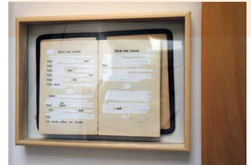
Insgesamt werden 60 Arbeiten an der KU präsentiert, sie sind im Alt- und im Neubau zu finden: etwa im Hörsaal, vor dem WC oder am Gang. Was ist Kunst, was ist nur ein Staubwölkchen, eine tote Fliege? – Die Betrachter/innen sind beim Entdecken der künstlerischen Arbeiten gefordert. Mit Absicht.