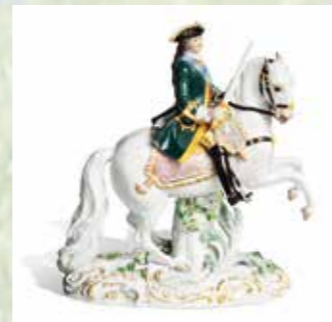
Zarin Katharina die Große zu Pferd